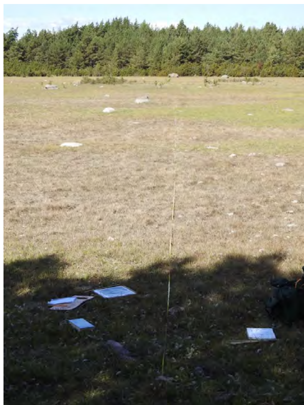
Figur 4: Transektens placering i Hyllekärr. Notera riktningen mot stort stenblock Foto: 2018-08-21.