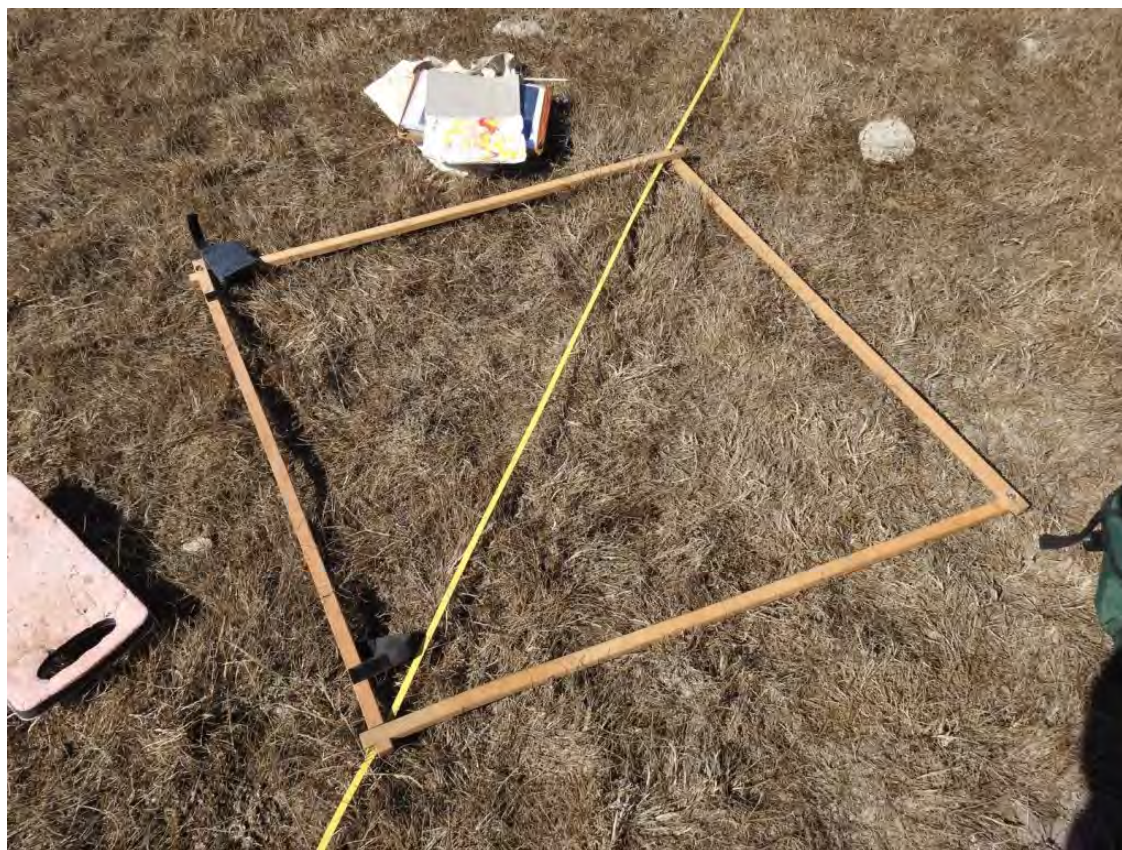
Figur 8: Provyta 3 (11,0m), ett krypvensamhälle