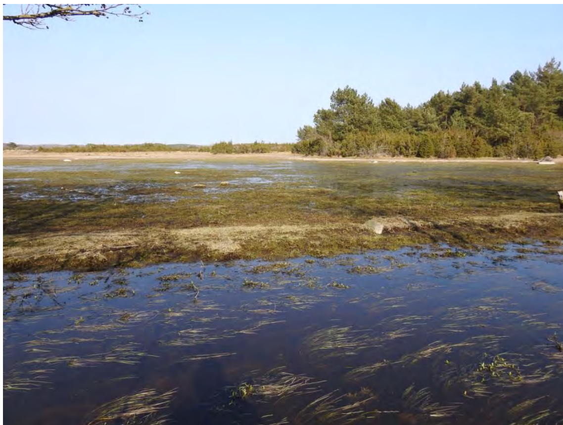
Figur 3: Våtmarken norr om Förakanalen med enbuskvegetationen där transektens 0-punkt är placerad. Vattenståndet visar förhållandena före dämning. Foto: 2018-04-13.