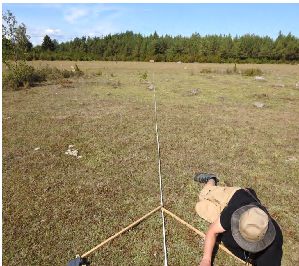
Figur 6: Moränrygg med glest en-och björkbevuxen, sällan översvämmad fuktig gräs-örtmark här i form av ett slankstarr-älväxing-revfingerörtsamhälle. Foto: 2018-08-21.