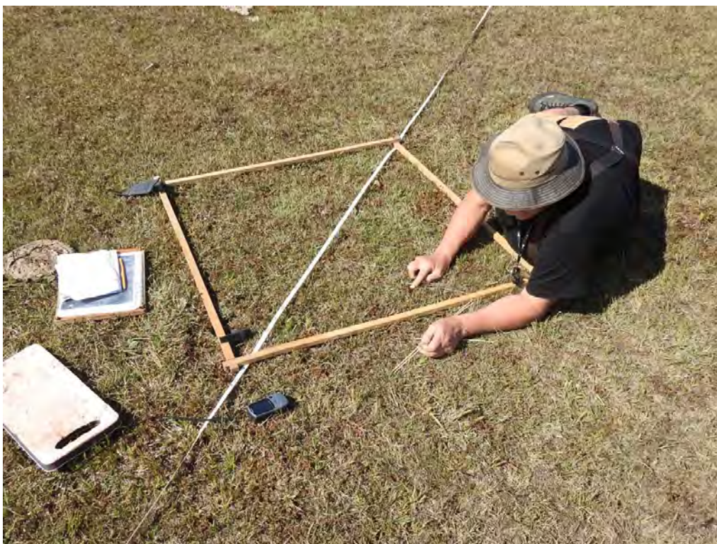
Figur 5: Provyta 4 (74,4m) ett slankstarr-älväxing-revfingerörtsamhälle. Foto: 2018-08-21