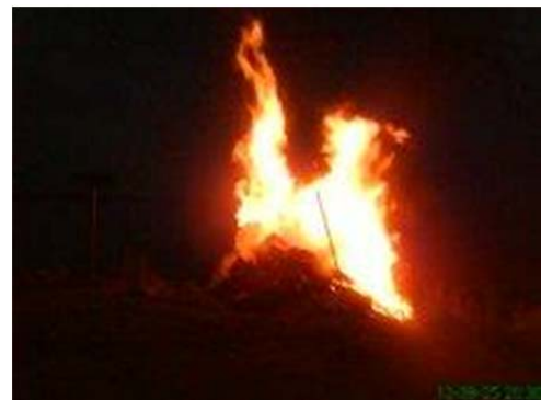
Bålet i Gräsgård.

På Öland deltog i år hamnarna i Gräsgård, Degerhamn, Stora Rör, Kårehamn, Sandvik och Böda i samarbete med lokala hamn-, samhällsföreningar och näringsliv.